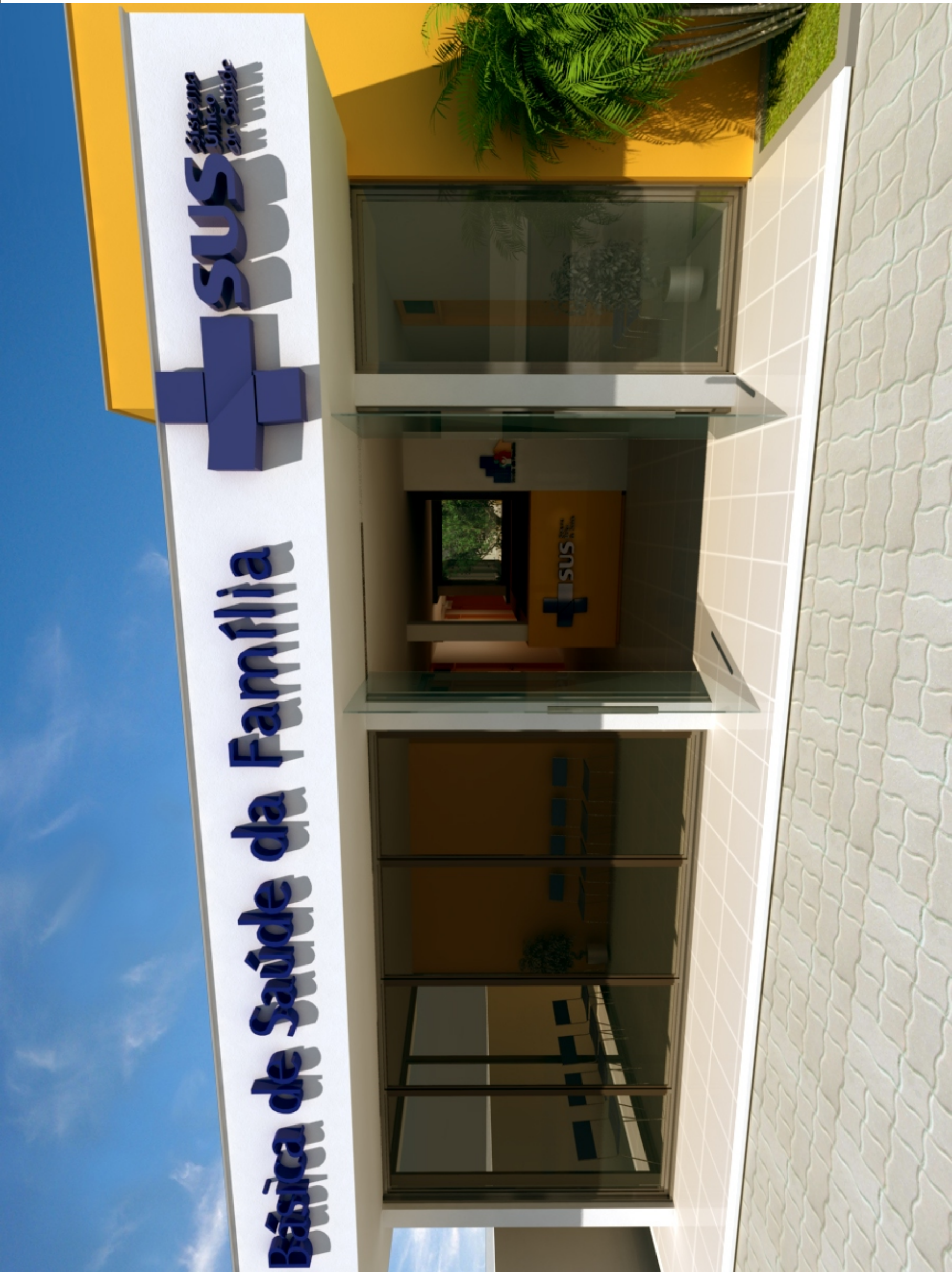
Imagem eletrônica 08